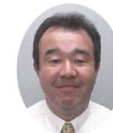
T・T L 作村 伸

魚谷会長から「こんな時期だからT・T やって盛り上げてくれ」との打診があり、 快く引き受けました。