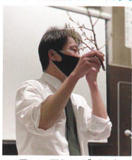
フラワーアレンジメント(11月19日)