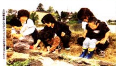
富山県立水橋中学校の生徒が、ライオンズクラブの指導員と一緒に、さつま芋の苗を植える体験学習を行いました。