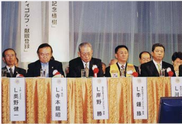
スポンサークラブ、姉妹クラブ、1RRC、1R2ZCの各位