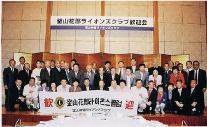
2009.5.8 (金) ANAクラウンプラザホテルにて